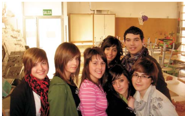
GRUPO BAILE 1º BACHILLER ARTÍSTICO