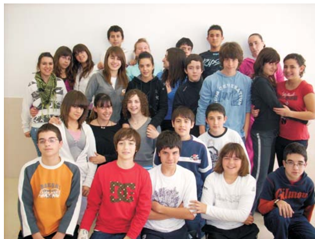
Alumnos de 2º C

La educación para la ciudadanía es una asignatura diferente de las demás. Con ella aprendemos que lo más importante es ser capaces de convivir y compartir nuestros esfuerzos para que el mundo sea mejor. En educación para la ciudadanía nos enseñan a ser buenos ciudadanos y a respetar a los demás. Nos enseñan nuestros derechos y deberes. En clase tenemos la oportunidad de contestar a esa pregunta y de plantearnos entre todos cómo lo podemos hacer para que sea posible. La ciudadanía es derecho y un deber. Ejercerla es la mejor manera de contribuir a la construcción de un modelo de vida feliz y de consolidar un sistema de convivencia más justo y democrático.